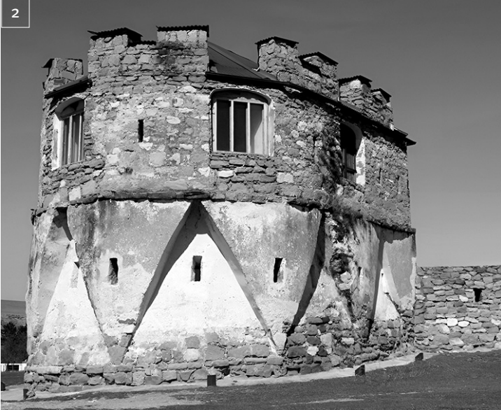
1. Экскурсия с Али-Булатом Булатовым сулит немало исторических открытий. 2. Красногорская сторожевая башня. Вид со стороны автодороги

Значение этого памятника велико, потому что на протяжении бывшей Кавказской линии в настоящее время не сохранилось в первозданном виде ни одного подобного сооружения, в то время как они тянулись непрерывной цепью, играя важную роль в событиях тех времен. Статус го-