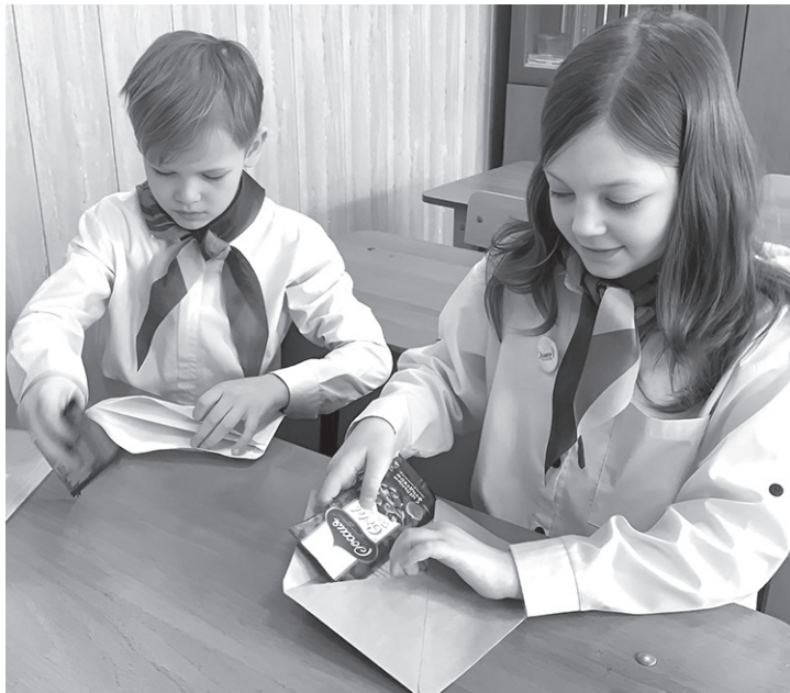
Школьники Ногайского района отправляют письма бойцам СВО

— Мы постоянно получаем с фронта хорошие новости об их