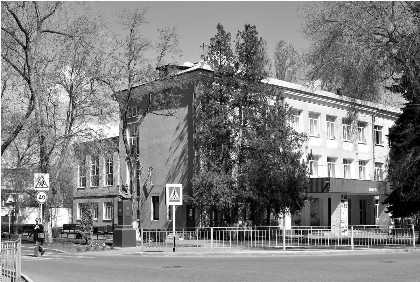
В недалеком будущем в Черкесске преобразится и облик Дворца детского творчества

— Одной из главных наших задач был анализ объектов социальной инфраструктуры. Мы постарались выяснить, хватает ли горожанам мест в дошкольных и школьных организациях, учреж-