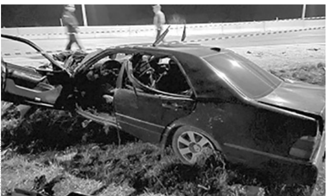
В этом «Мерседесе» ехало четыре человека. В результате аварии один погиб, трое травмированы

28 марта в 20:29 на федеральной автодороге «Черкесск—Домбай» водитель автомашины «Мерседес Е-320», предположительно 57-летняя жительница г. Усть-Джегуты, не справившись с управлением и допустила наезд на столб дорожного освещения. В результате ДТП пассажир, 42-летний житель с. Архыз, от полученных травм скончался на месте происшествия, в лечебное учреждение помещены водитель и два пассажира.