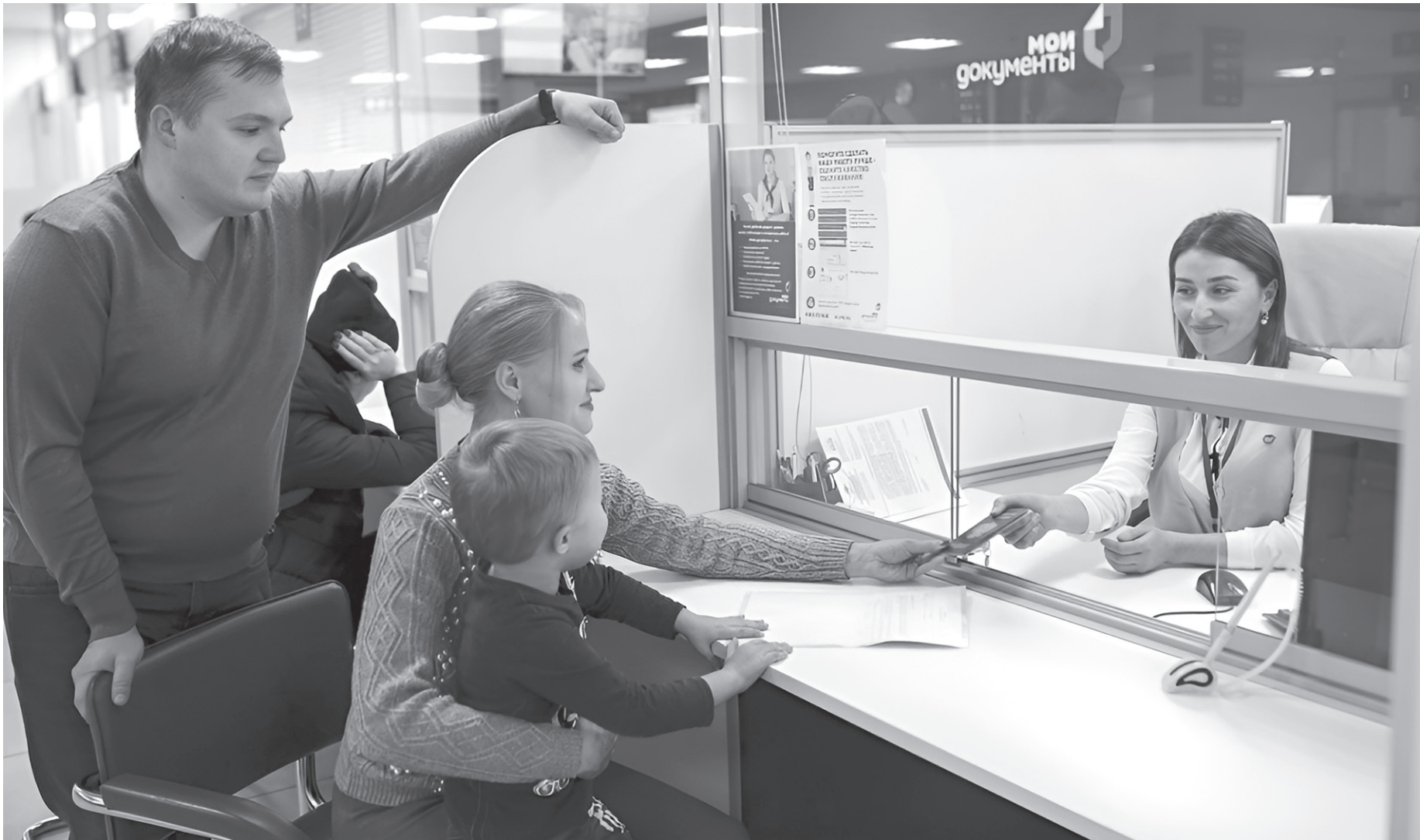
С открытием семейного МФЦ получить услуги семьям с детьми будет гораздо проще

Первый в нашей республике семейный МФЦ планируется открыть в Черкесске в ближайшее время. Участники встречи рассмотрели вопросы о месте, где он будет располагаться, о кадровом составе, перечне услуг,